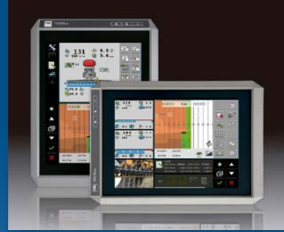
Terminal virtual ISOBUS certificado. Serie Sense Touch.