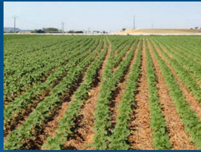
Control de secciones fila a fila.