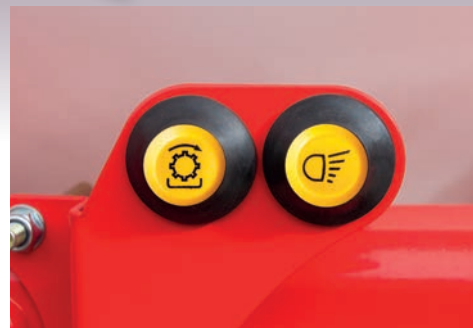
Control simplu pentru actionarea sneului de incarcare(optional) si luminilor de lucru(standard)