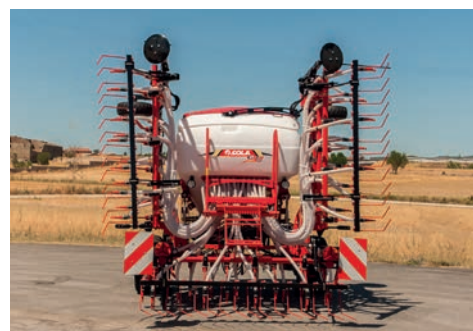
Pozitie de transport