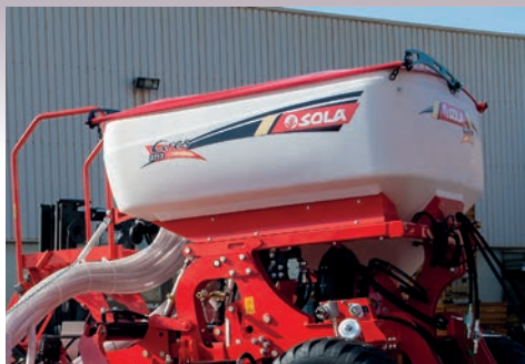
Bazin de 1600 litri, disponibil si la 2000 litri. Ambele de serie.