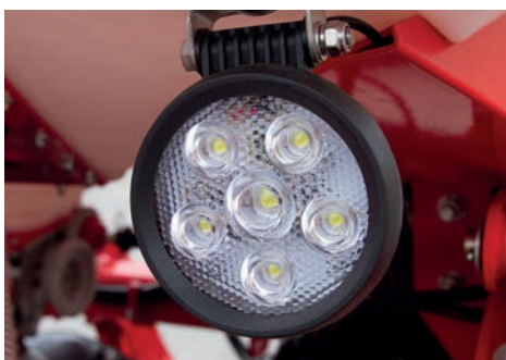
Lumini de lucru cu LED de putere mare