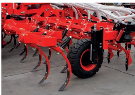
Versiune cu cultivator anterior si scormonitori urme tractor