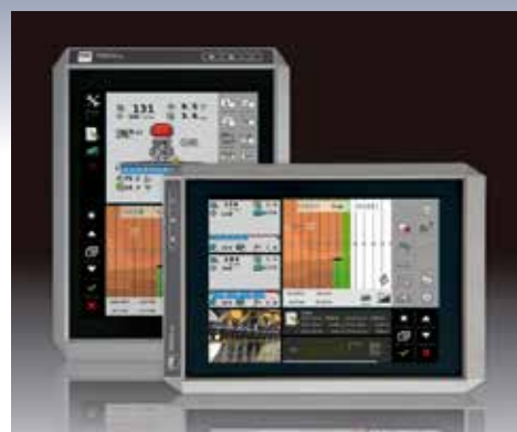
Large gamme disponible de contrôleurs virtuels.