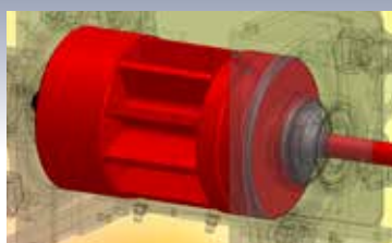
Distributeur volumétrique à entraînement électrique à rouleaux modulaires interchangeables.