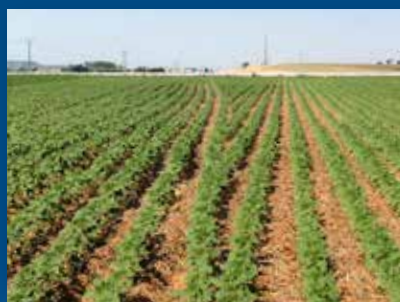
Секційний контроль кожного ряду