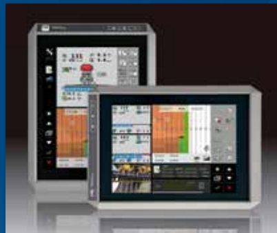
Сертифікований віртуальний термінал ISOBUS з сенсорним монітором