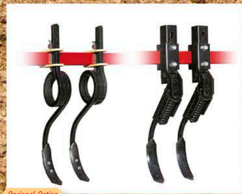
Opcional-Option Borrahuelas con muelles o tipo "Ransome" - Spring tine or "Ransome" track erasers - Effaceur des traces à ressort ou "Ransome"