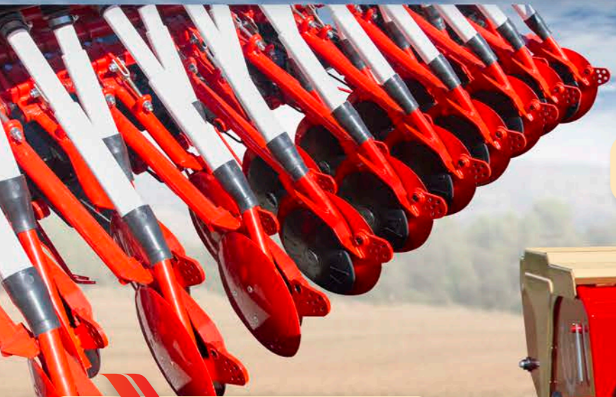
Brazos de disco con discos rascadores de control - Disc coulters with scraper's discs control - Disques avec grattoirs à disque de controle

Sembradora mecánica - Mechanical seed drill - Semoir mecanique