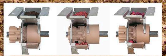
Distribuidor regulable para todo tipo de semillas. - Adjustable distributors for all type off seeds. - Distributeurs réglables pour tous les types de semences.