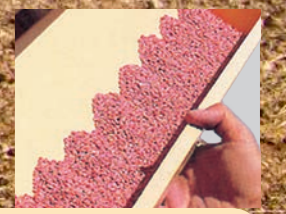
Bandeja para el pre-control de la semilla. - Seed calibration cup. - Auget pour le pre-contrôle de la semence.