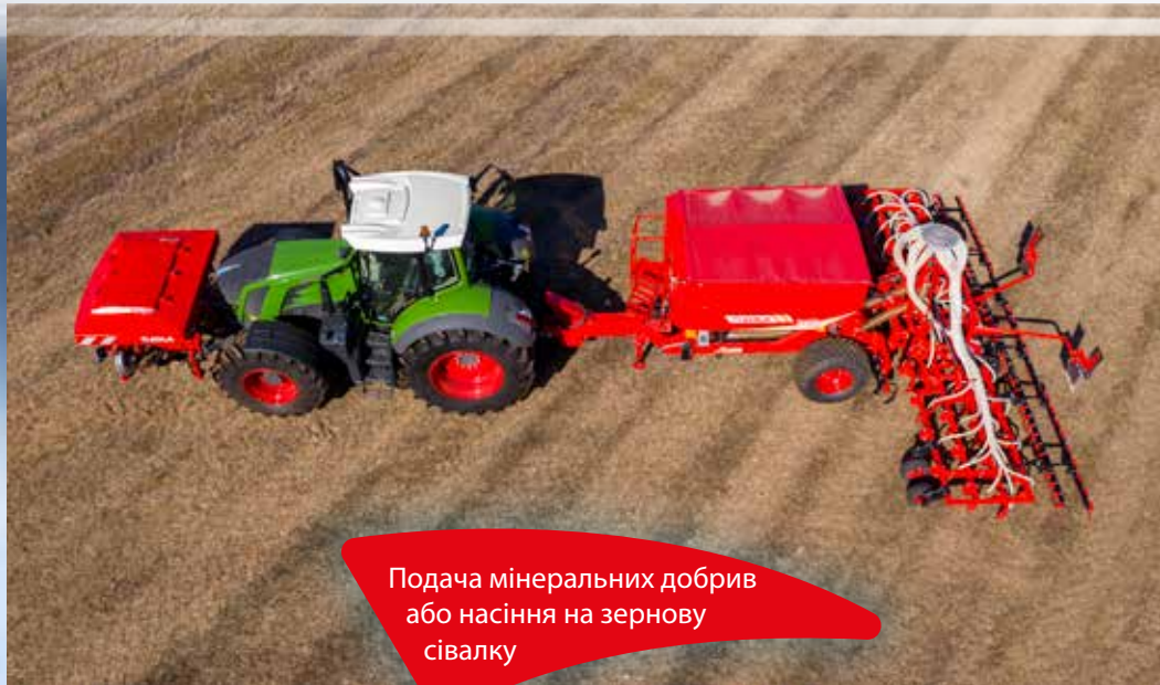
Подача мінеральних добрив або насіння на зернову сівалку