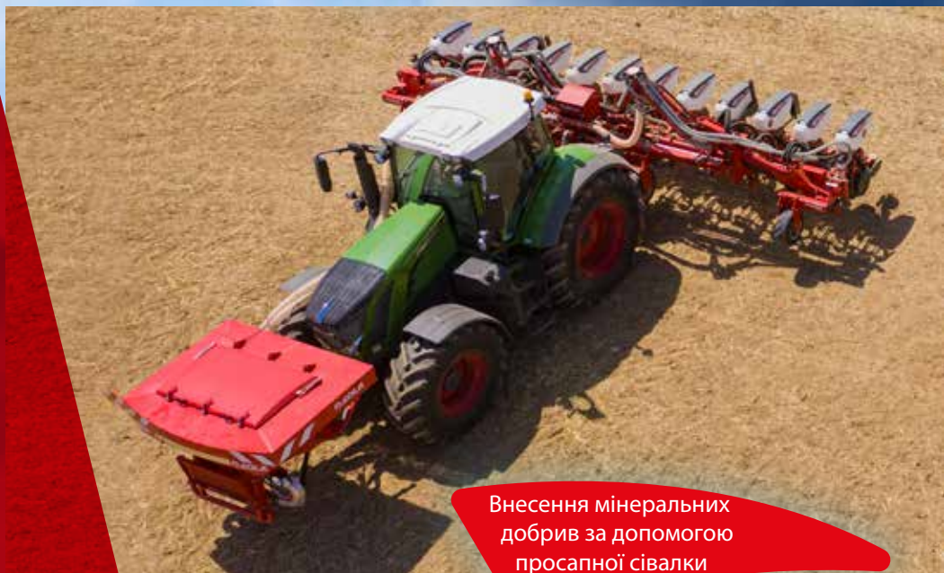
Внесення мінеральних добрив за допомогою просапної сівалки